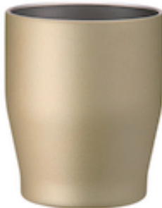
シャンパンゴールド