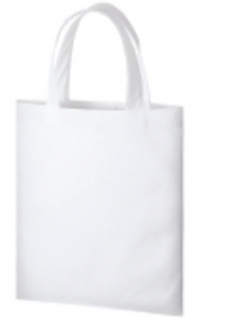
ナチュラルホワイト