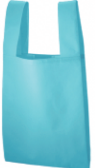
フロスティブルー