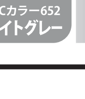
DICカラー652 ライトグレー