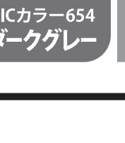
DICカラー654 ダークグレー