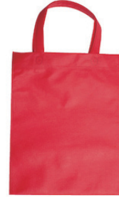
イタリアンレッド