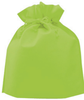
イエローグリーン