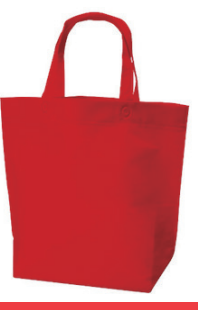
イタリアンレッド