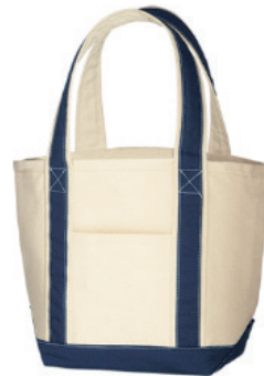
ミッドナイトブルー