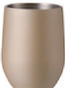
シャンパンゴールド