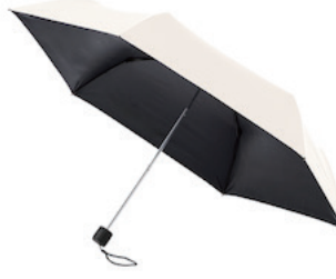
ミルキーホワイト