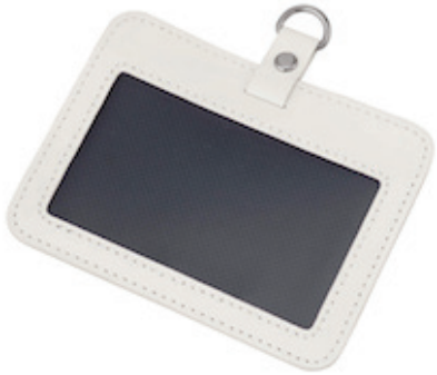
ミルキーホワイト